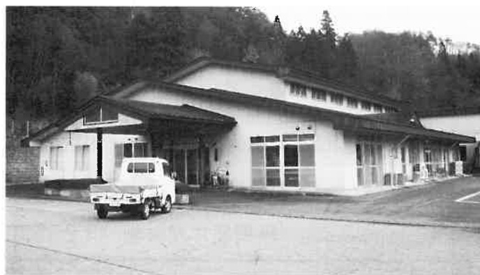
デイサービスセンター 仙水園