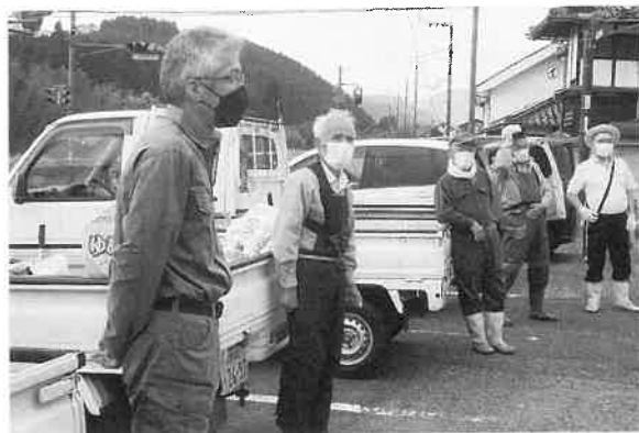
大朝支所 (ボランティア活動の風景)

れた豊富な経験と知識、技能を十分に活かしていただき、シルバー人材センターの活動を通して、活力ある地域社会に貢献していただきますようお願い申し上げます。