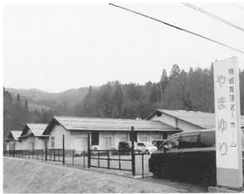
特別養護老人ホーム やまゆり

最初は自分に務まるだろうかと、不安でしたが、先輩のご指導のお陰で今日に至っています。清掃メンバーは三名で交代してやっています。が、今一人欠員の為二人で交代して作業しています。今日迄、続けて作業出来たのは、色々な方との出会いがあり温かく声をかけて頂いた賜と思います。有り難うございます。 そして目覚めと共に、今、自分に出来る事があるという事が元気の源と感謝しています。どうぞ志のある方一緒に働きましょう。お待ちしております。