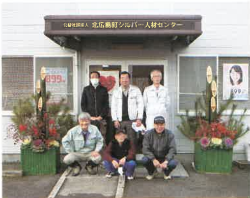
会員有志による門松設置

就業報告書は発注者への請求額や配分金を計算する大事な書類です。作業が終了したら自分で記入し、発注者の確認印をもらって早急に提出してください。 月末まで就業する場合は、翌月二日までは必ず提出してください。就業報告書の提出が遅れると、発注者への請求、会員への配分金の支払いができませんので注意してください。