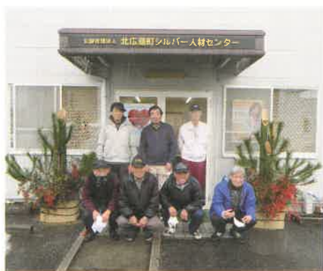
会員有志による門松設置

月末まで就業する場合は、翌月二日までは必ず提出してください。就業報告書の提出が遅れると、発注者への請求、会員への配分金の支払いができませんので注意してください。