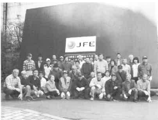
会員研修：JFEスチール

本年も会員様の笑顔が輝き、 明るく幸せな一年になります よう福利厚生委員会は一丸と なって取り組んでまいります。