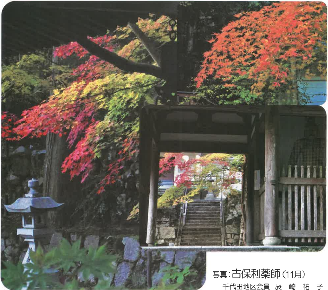
写真:古保利薬師(11月)