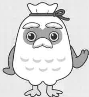
シルバー人材センターゆるキャラ「チエブクロー」