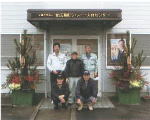
会員有志による門松設置

月末まで就業する場合は、翌月二日までは必ず提出してください。就業報告書の提出が遅れると、発注者への請求、会員への配分金の支払いができませんので注意してください。