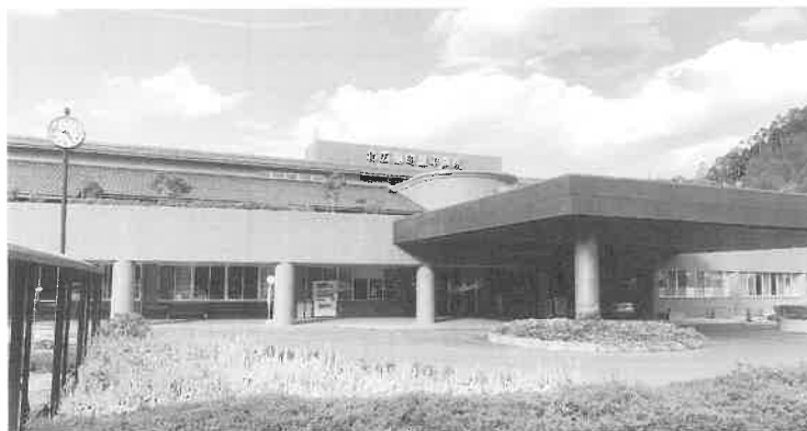
北広島町豊平診療所

拠点となれるよう、携わって頂く会員の方と職員とが協力しあい運営してまいりますので、これからも一層のご協力とご支援のほど宜しくお願ひ申し上げます。