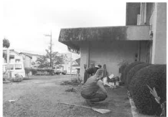
豊平地域づくりセンター奉仕作業

これまで活動してくださった先輩の方が退かれました。昨年からは四名で草取りグループで活動を始めました。昨年一名新規会員の方が入って下さり、五名で活動しました。お金をいただく仕事なので、草取りと言えど結構辛い仕事です。発注はお盆前が多く暑さとの戦いです。そのため早朝から、午前中で終了するやり方です。でも、作業は辛くても、メンバー同志での声掛けで笑い声の絶えない現場です。もう少し草取りメンバーに加わって下さる方が増えたら、短時間作業になると思います。草取りの好きな方いらっしゃいますか！