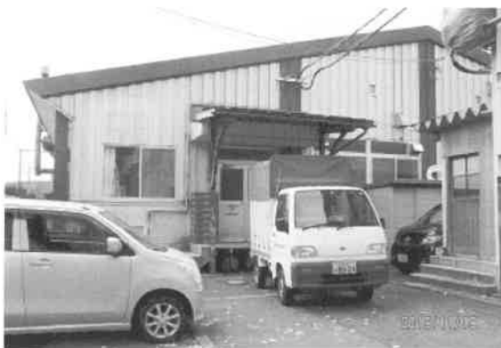
大朝学校給食共同調理場