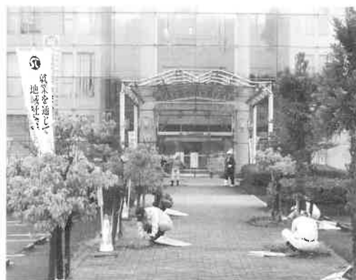
北広島町役場本庁舎(作業風景)