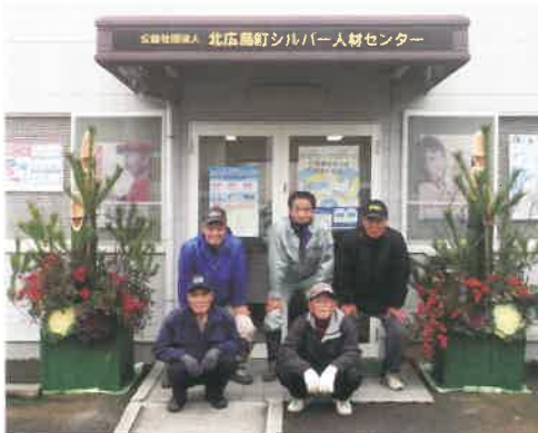
会員有志による門松設置

月末まで就業する場合は、翌月二日までには必ず提出してください。就業報告書の提出が遅れると、発注者への請求、会員への配分金の支払いができませんので注意してください。