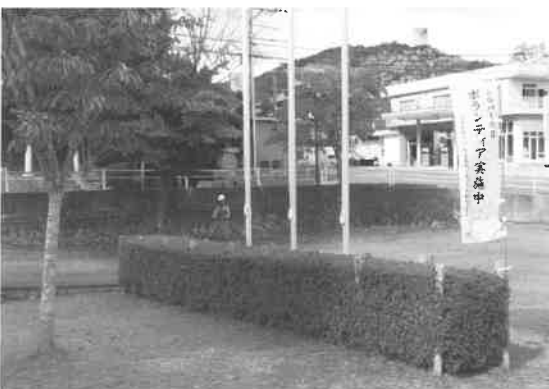
北広島町役場芸北支所 奉仕作業