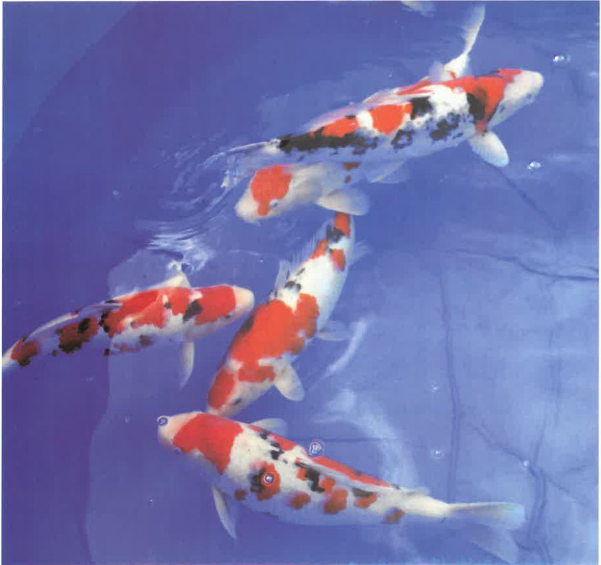
写真・鯉の品評会 全日本愛鱗会広島支部北分会 (11月今吉田)