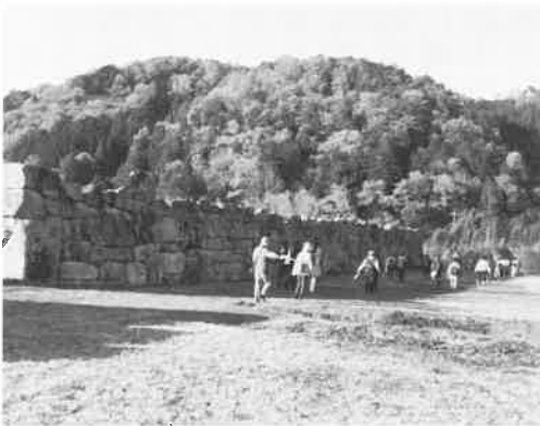
吉川元春館跡石垣

来訪者が少しでも気持ちよく見学できるよう丁寧に草刈り作業をしていただき心から感謝申し上げます。おかげをもちまして、とても綺麗になり来訪者の方々に気持ちよく過ごしていただいております。今後も皆様の豊富な経験と知識を活かされ活力ある地域社会に貢献していただきますようお願い申し上げます。