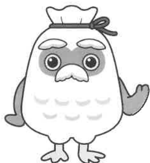
シルバー人材センターゆるキャラ「チエブクロー」