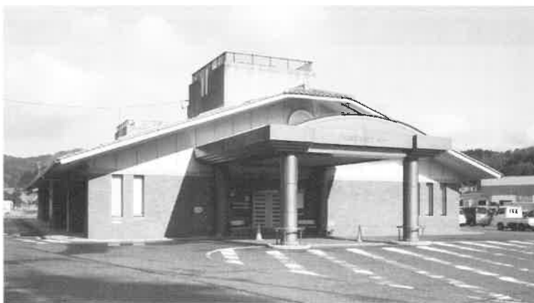
大朝福祉センター

でき、おかげさまで来館者に は、快適に過ごしていただい ています。 引き続きシルバー人材セン ターによる清掃と職員の「お もてなし」の気持ちをもって 福祉センターの管理運営をし ていきます。