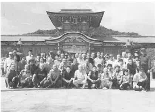
会員研修：防府天満宮