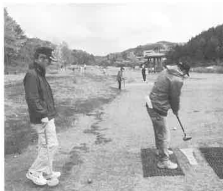
グラウンドゴルフ大会

工場を見学して、防府天満宮を参拝、堀庭園を見学し、一路帰路につきました。今年も研修旅行を計画して居りますので、健康でまた会いましょう。