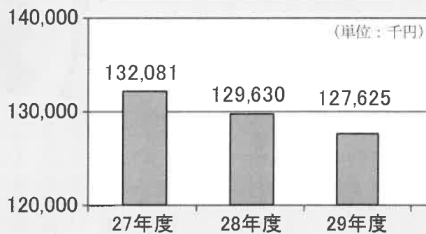
平成 27～29 年度 契約額

受託事業の平成二十九年度契約金額は一億二千七百六十二万五千円。前年度より二百萬五千円の減。